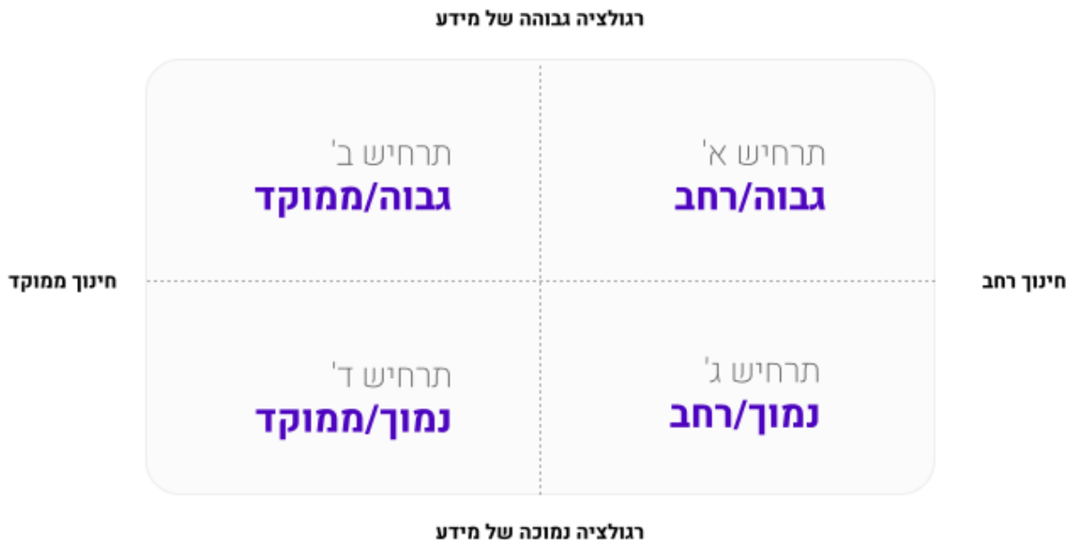
תרשים 5: מידת הפיקוח וממשל הנתונים

להלן מטריצה המציגה ארבעה תרחישים הנגזרים משני הגורמים: